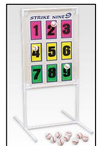
↑ストライクナイン

生活訓練は市内で初めての事業所です。「〇〇をしなければならない。」という決まりはありませんので、就労継続支援B型の利用が難しかった方などぜひ一度見学にいらしてください。